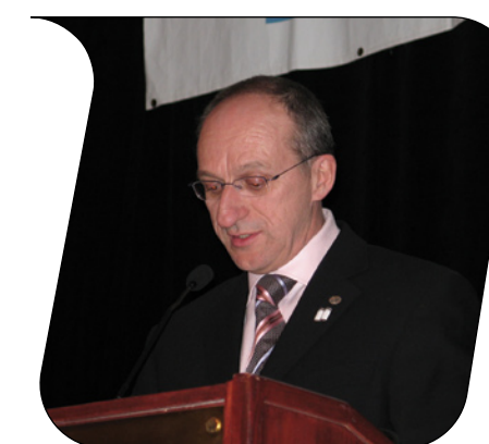
Yvon Vallières, ministre de l'Agriculture, des Pêcheries et de l'Alimentation du Québec, annonçait la création de Valacta, centre d'expertise en production laitière du Québec à l'Assemblée générale annuelle de la FPLQ, le 12 avril 2006.

* Programme d'analyse des troupeaux laitiers du Québec