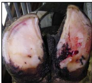
Ulcère de la sole