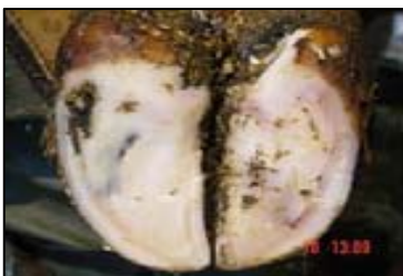
Maladie de la ligne blanche