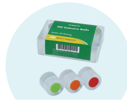
▶ COLOSTROBALLS Colostrum à 20°C lors du test