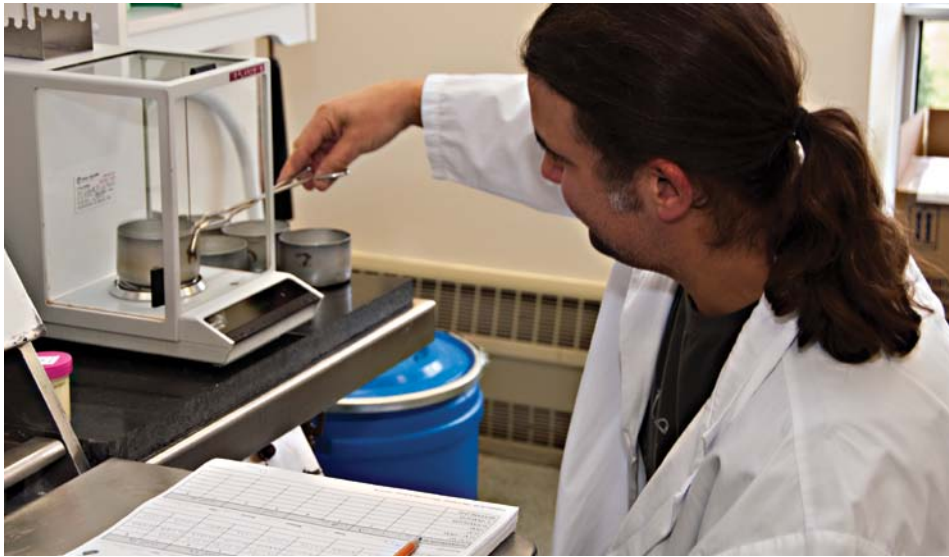
Technicien qui effectue des manipulations dans le laboratoire de référence.