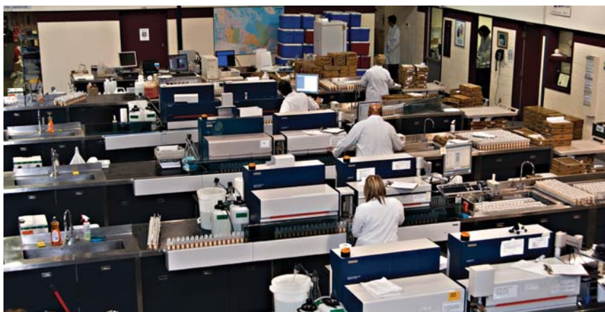
Vue du laboratoire Valacta montrant les lignes d'analyse équipées d'un analyseur infrarouge pour la composition et d'un compteur de cellules somatiques.

L'autre atout de ces analyseurs et non le moindre réside dans l'enregistrement de toute une région spectrale pour chaque composant mesuré, ce qui donne la possibilité de développer des applications spécifiques pour les besoins des laboratoires. L'introduction de cette nouvelle gamme d'analyseurs au laboratoire a permis à Valacta d'être l'un des premiers laboratoires au monde à offrir