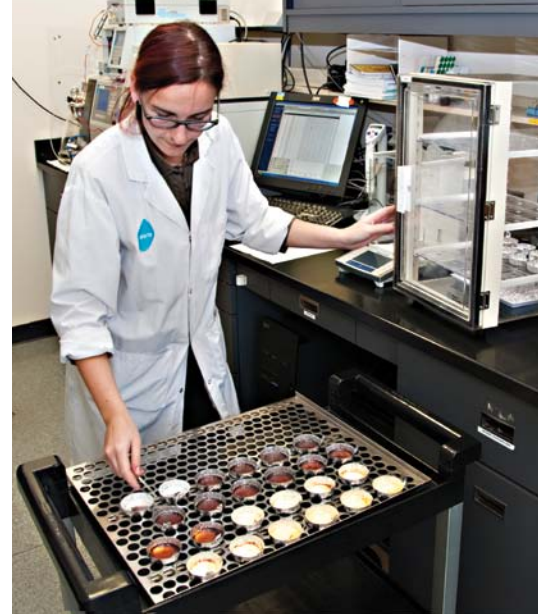
Technicienne qui effectue des manipulations dans le laboratoire de référence.

On procède à l'étalonnage de chaque instrument une fois par semaine. De plus, un échantillon témoin (dont la composition déterminée par méthode directe est