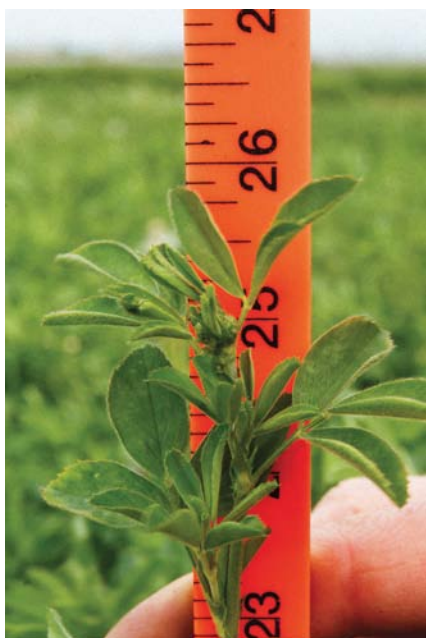
Luzerne stade bouton-début floraison